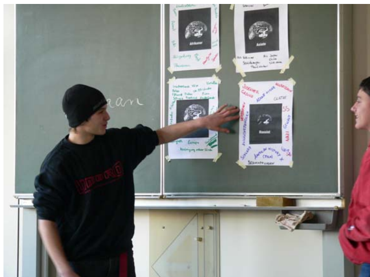
Schülervortrag „Aktiv gegen rechts“