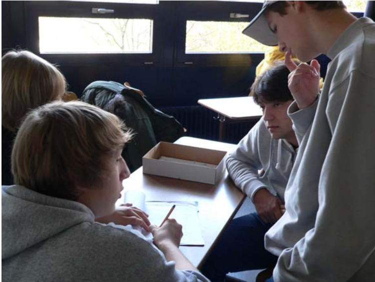
Planung des Unterrichts