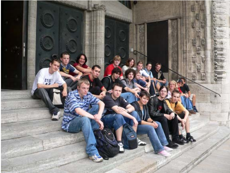
Die Klasse vor der Alten Synagoge Essen