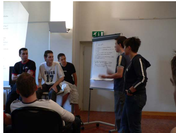
Präsentation der Ergebnisse