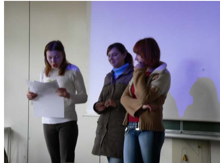
Schülerinnen präsentieren Ergebnisse