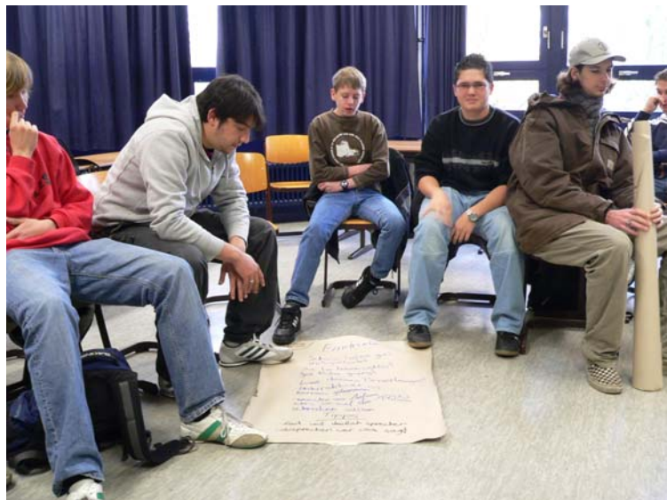
Vorstellung von Ergebnissen