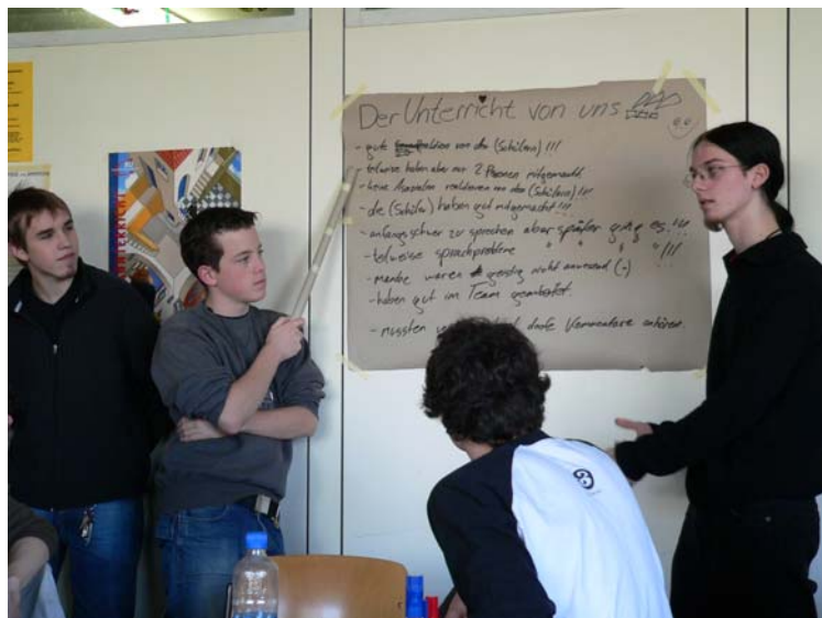
Präsentation „Unser Unterricht“