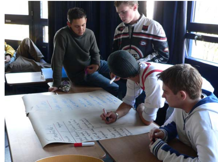
Auswertung in Gruppenarbeit