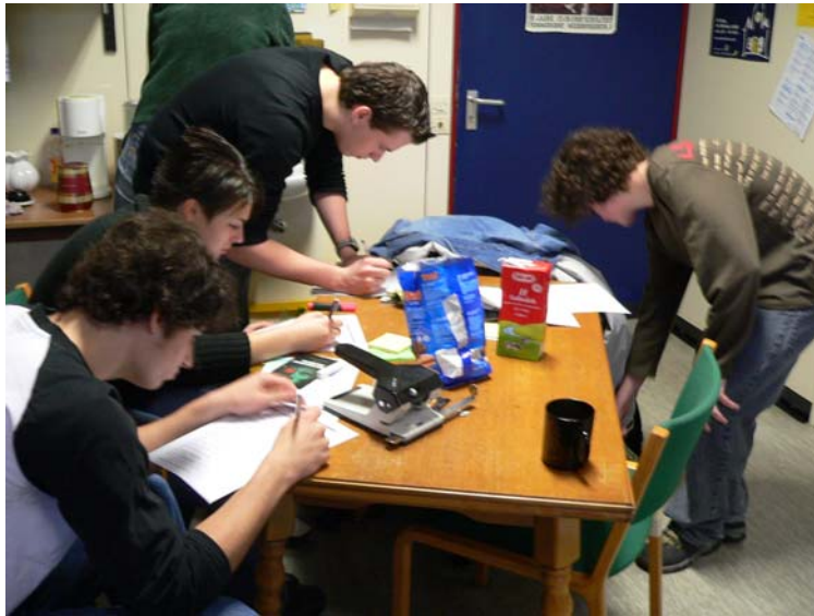
Festhalten erster Eindrücke nach der Stunde