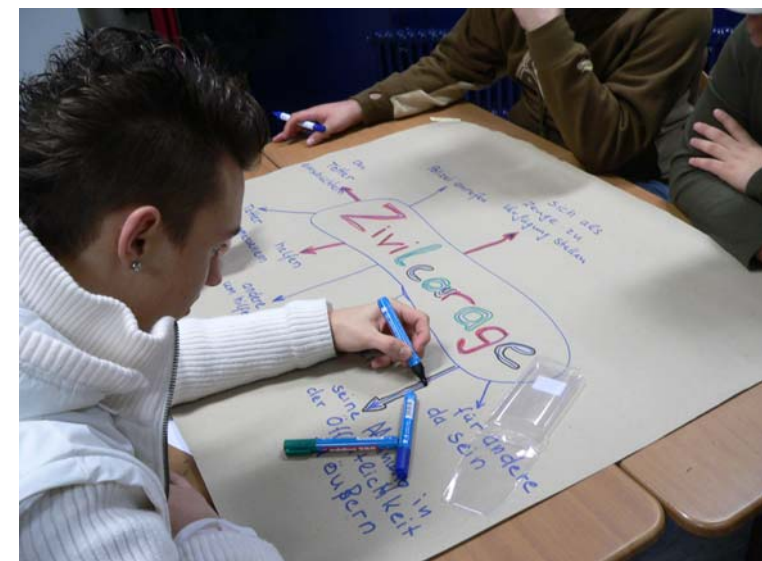
Ein Ergebnisplakat entsteht