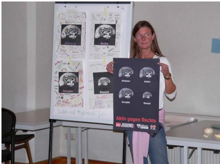
Diskussion des Plakats „Aktiv gegen rechts“