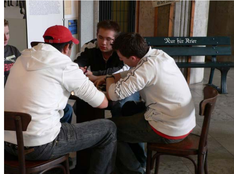
Intensive Gruppenarbeit in der Synagoge